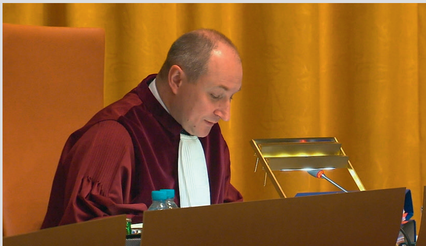
Der Generalanwalt am Europäischen Gerichtshof, Maciej Szpunar .

Fällt der EuGH ein den Schlussanträgen entsprechendes Urteil, fürchtet Schwarz einen weitreichenden Eingriff in das System der Freien Berufe in Deutschland: »Zwar erstreckt sich das Vertragsverletzungsverfahren nicht