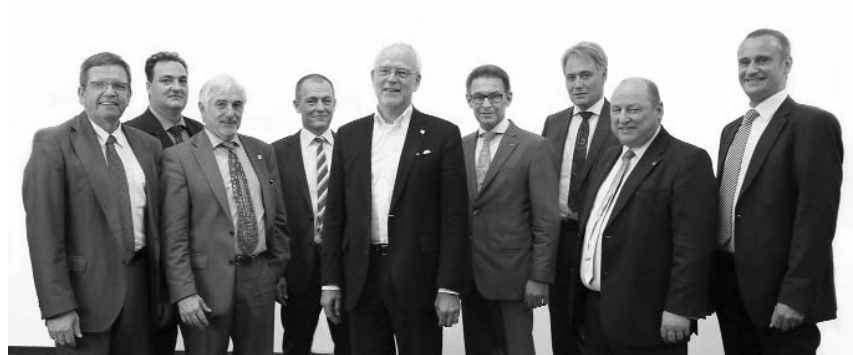
Fünf Vorstandssitzungen fanden bislang seit der Wahl Ende November statt.

Die beliebten, kostenfreien Musteringenieurverträge der Kammer werden auf Beschluss des Vorstands um ein