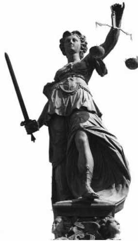
Ab 1. Januar gibt es viele Änderungen.

Heftig umstritten war die Normierung eines Anordnungsrechts des Bestellers im Rahmen des Bauvertrages. Als eine der gravierendsten Änderungen findet es sich im neuen § 650b BGB. Grundsätzlich soll bei einem Änderungsbegehren ein Einvernehmen zwischen Besteller und Unternehmer über Änderung und Vergütung erzielt werden. Erfolgt keine Einigung innerhalb von 30 Tagen kann der Besteller die Änderung anordnen und der Unterneh-