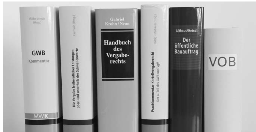
Das Urteil des OLG München könnte ein Umschreiben der Vergabeliteratur nötig machen.

Im konkreten Streitfall hatte ein öffentlicher Auftraggeber Leistungen der Tragwerksplanung ausgeschrieben, deren Wert den Schwellenwert für die EU-weite Ausschreibung nicht erreicht hat. Dennoch wurde der Auftrag europaweit ausgeschrieben. Nachdem ein nicht berücksichtigter Bieter die Nachprüfung beantragt hatte, berief sich der Auftraggeber darauf, dass der Schwellenwert nicht erreicht und die Überprüfung deshalb unzulässig sei. Das OLG München erklärte den Nachprüfungsantrag dagegen für statthaft und stützte sich auf den Ausschreibungstext, wonach alle Planungsdisziplinen „lückenlos aufeinander abgestimmt und optimiert“ werden müssten und deshalb eine „Einheit ohne Schnittstellen“ bildeten. Die Beurteilung, ob der EU-Schwellenwert überschritten wird, sei deshalb anhand der Addition der Werte der einzelnen Planungsaufträge vorzunehmen.