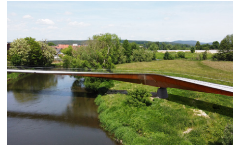
Regenbrücke Roding Mayr | Ludescher | Partner

Die Fuß- und Radwegbrücke Offenbachstraße zeichnet sich durch ihre optimale Anpassung an die örtlichen Gegebenheiten aus und berücksichtigt in ihrer Komplexität verschiedene und schwierige Verkehrssituationen, einschließlich der benachbarten Bahnstrecke München-Pasing. Die sorgfältige Materialwahl trägt dazu bei, dass die Brücke besonders wartungsarm ist und zugleich ein elegantes und nutzerfreundliches Design bietet.