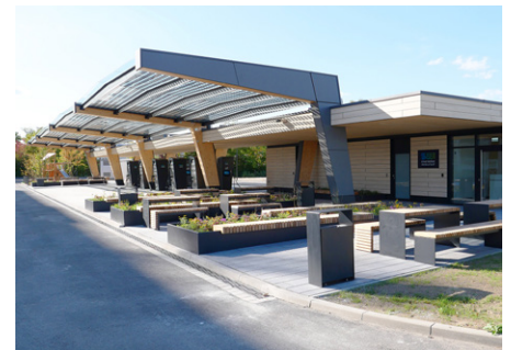
SWI Schnellladepark am incampus pbb Planung + Projektsteuerung GmbH

Das innovative, von einem jungen Team realisierte Projekt beeindruckt durch seine Interdisziplinarität sowie den Mut, neue Wege zu beschreiten. Das gute Teamwork insbesondere der THA und des Vereins Surffreunde Augsburg e.V. sowie das Einbinden der lokalen Gemeinschaft ist vorbildlich. Dies und die innovative Materialwahl (u.a. Carbon-Recyclingbeton) machen die Surfwelle Augsburg zu einem herausragenden Ingenieurbauprojekt.