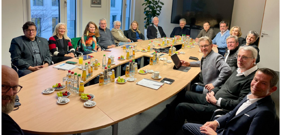
Die Ingenieure- und die Architektenkammer wollen noch enger zusammenarbeiten.