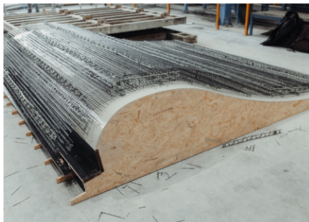
Surfwelle Augsburg Technische Hochschule Augsburg (THA)

Besonders herausragend an diesem Projekt ist der Mut der Bauherren und des Unternehmers, eine innovative Bauweise zu verfolgen und für eine Typengenehmigung im seriellen Holzwohnungsbau einzusetzen. Diese wegweisende Initiative hat das Potenzial, die gesamte Baulandschaft zu transformieren, insbesondere im Kontext des dringend benötigten Wohnraums. Diese Bauweise setzt neue Maßstäbe in der Modularität.