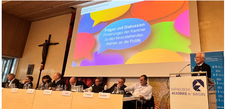
Bundestagswahl im Blick: Der Vorstand tauscht sich mit der Vertreterversammlung zu politischen Forderungen des Berufsstandes aus.

Intensiv diskutierten die Vertreterinnen und Vertreter mit dem Vorstand darüber, welche politischen Forderungen die Kammer gegenüber der Politik vertreten solle. Die Punkte wurden herausgearbeitet und sind Hauptgegenstand der politischen Kommunikation in den kommenden Monaten. Die Kammer fordert: