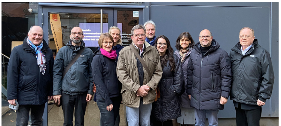
Der Ausschuss Leben | Arbeit | Karriere besichtigte mit den Kolleg:innen der Ingenieurkammer Baden-Württemberg die 2. S-Bahn-Stammstrecke.

Die beiden Gremien hatten sich bereits letztes Jahr in Stuttgart getroffen; nun stand der Gegenbesuch in München an. Neben den besonderen Bedarfen der angestellten und beamteten Mitglieder standen auch Möglichkeiten der Ansprache von Studierenden und Berufseinstei-