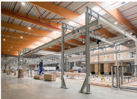
Serieller Wohnungsbau FIRE & TIMBER ING. GmbH

Das wunderschöne, schlanke und unaufdringliche Bauwerk folgt dem Prinzip 'Form follows function'. Durch die zentrale Aussichtsplattform auf dem Steg wurde ein neuer Aufenthaltsraum geschaffen. Die durchdachte und umweltfreundliche Gestaltung macht die Brücke zu einem besonderen Beispiel für funktionale und ästhetische Ingenieurbaukunst, die sich unauffällig in die natürlichen Gegebenheiten einfügt.