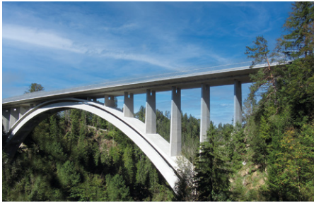
Echelsbacher Brücke Dr. Schütz Ingenieure

Die unter Denkmalschutz stehende Echelsbacher Brücke über die Ammerschlucht ist die älteste Melan-Bogenbrücke der Welt. Die charakteristischen Bögen mit einer Spannweite von 130 m und einer Bogenhöhe von 32 m konnten erhalten und harmonisch mit dem Neubau verbunden werden. Auch den vielfältigen Aspekten des Naturschutzes wurde dank einer ausgefeilten Planung in idealer Weise Rechnung getragen.