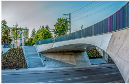
Fuß- und Radwegbrücke Offenbachstr. WTM Engineers München GmbH

Die unter Denkmalschutz stehende Echelsbacher Brücke über die Ammerschlucht ist die älteste Melan-Bogenbrücke der Welt. Die charakteristischen Bögen mit einer Spannweite von 130 m und einer Bogenhöhe von 32 m konnten erhalten und harmonisch mit dem Neubau verbunden werden. Auch den vielfältigen Aspekten des Naturschutzes wurde dank einer ausgefeilten Planung in idealer Weise Rechnung getragen.